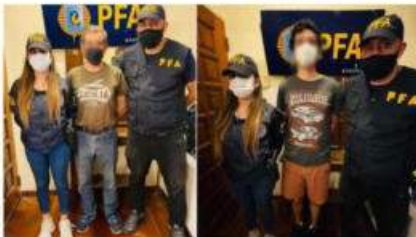
La PFA detuvo a un hombre y a su hijo en Villa Urquiza.

Fecha de publicación: 17 de marzo 2022, 19:22hs